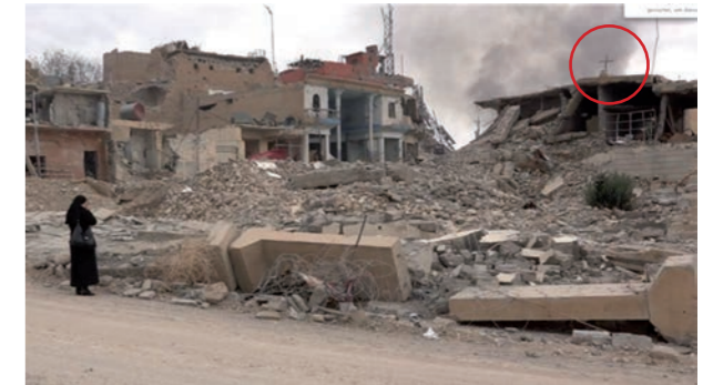
Von Jihadisten zerstörte christliche Kirche in Shingal Stadt, Irak

In islamisch dominierten Ländern, in denen die Scharia die Basis geltenden Rechts ist, existiert keine Glaubensfreiheit. So wird etwa im Ursprungsland des Islam, Saudi-Arabien, die Lossagung vom Islam mit dem Tod bestraft. Alle anderen Religionen haben in dem Land kein Existenzrecht.